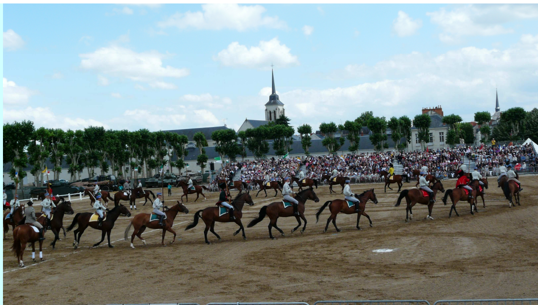
Un carrousel exemplaire

C'est après le pique-nique que nous nous sommes quittés très tard mais tous émerveillés par ce spectacle inoubliable.