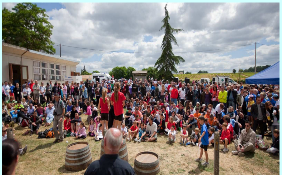
L'attente avant la remise des récompenses