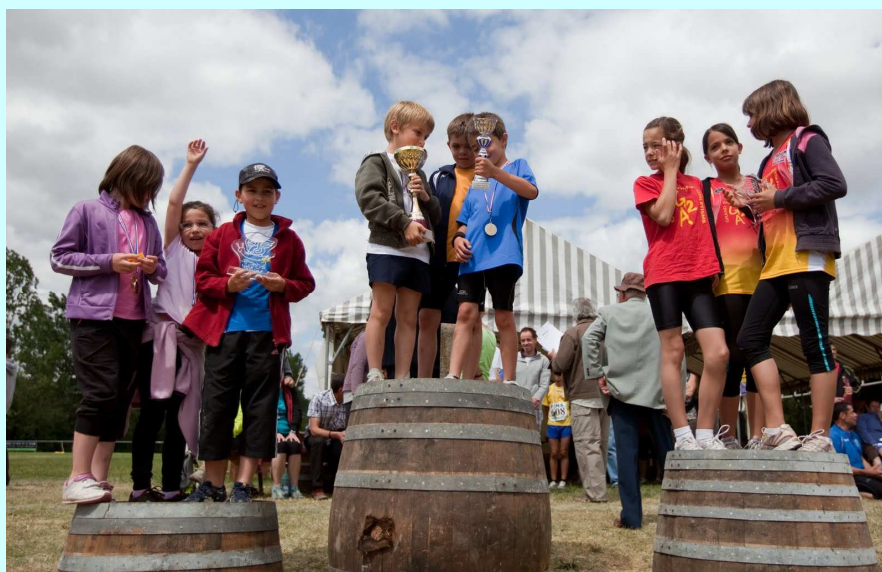
Les enfants sur le podium