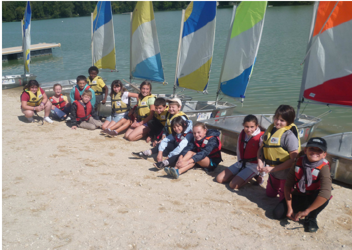
Les apprentis navigateurs

Tandis que les CM mettent le cap tous les mardis sur le plan d'eau de Saint Yrieix, les CE préparent leurs « petites escapades », titre de leur film présenté dans le cadre d'Ecole et Cinéma.