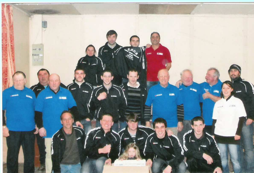
AS Mosnac/Champmillon 2011/2012

Pour les deux repas du premier semestre 2012, les dates ne sont pas encore arrêtées.