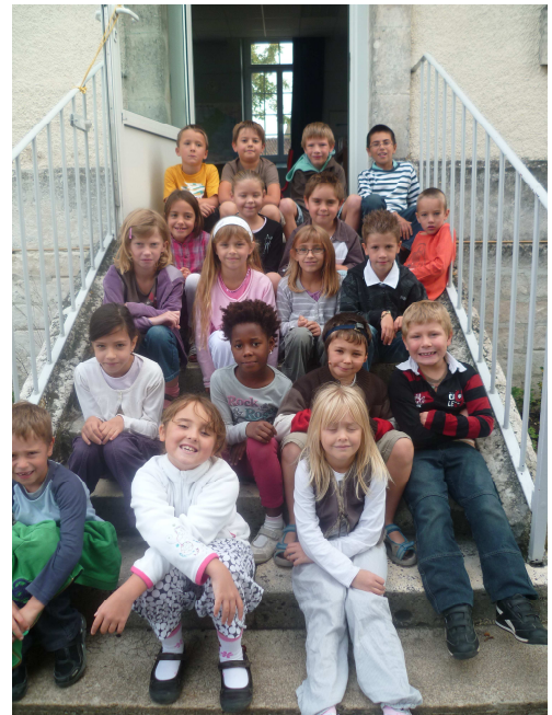
Les élèves 2011/2012

Les bancs de l'école c'est aussi des maths (comptage des marrons tombés !), de la science (observation le pigeon et sa portée), du français (commentaires des articles du journal « mon quotidien »), etc.