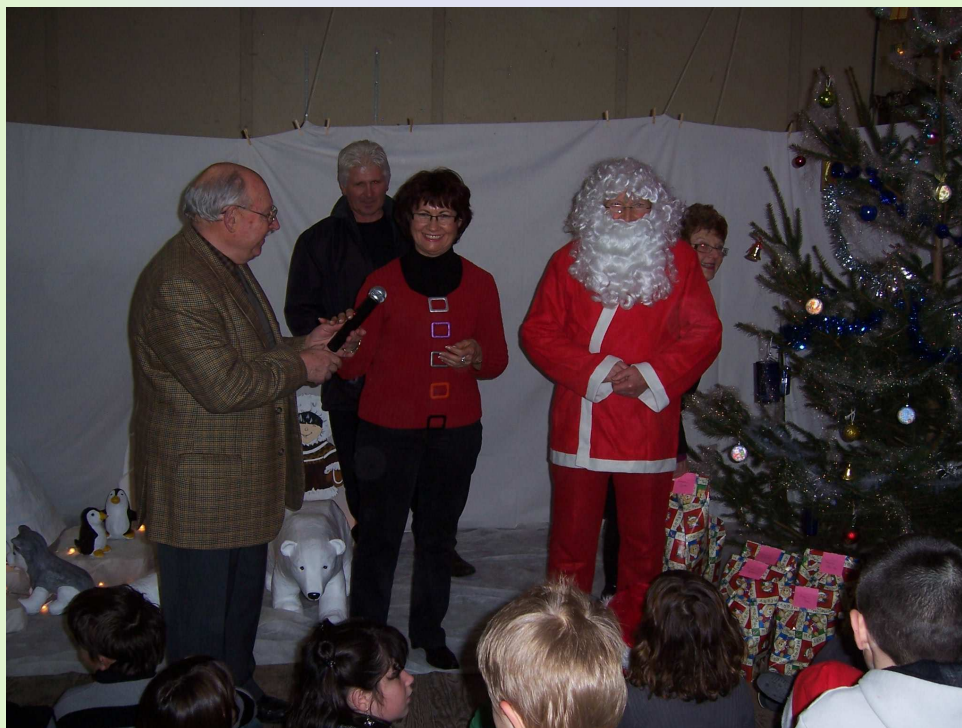
Remise des cadeaux aux enfants

La soirée s'est achevée comme d'habitude autour du goûter apprécié des enfants et du « punch » apprécié des parents.