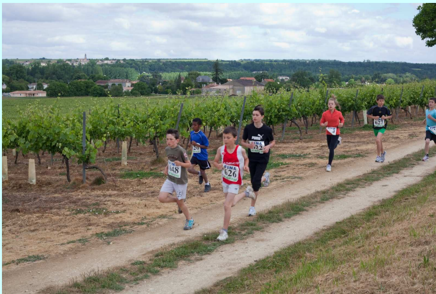
La valeur n'attend pas le nombre des années