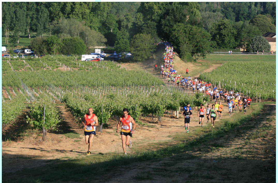
Courir au milieu des vignes

Un très grand merci à tous les bénévoles, les propriétaires qui nous suivent depuis plusieurs années, sans eux rien n'aurait été possible.